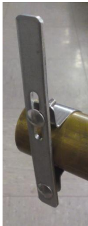
Gerade 1,50 € + MWst

Es kann zwischen drei Varianten gewählt werden. Die gerade Halterung und der gebogene Haken dienen zur Befestigung an Querstangen. Wo das nicht möglich ist, kann der Winkel an einer senkrechten Stange befestigt werden. Es stehen Schellen mit 40, 50 und 60 mm Durchmesser zur Auswahl, die sich aber durch die Längsschlitze an weitere Durchmesser anpassen lassen.