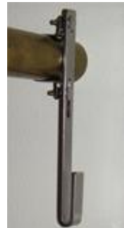
Bogen 2,20 € + MWSt

So hängen die LactoCorder nicht nur sicher, sie können auch sehr einfach befestigt werden. Außerdem hängen die LactoCorder senkrecht, was sehr wichtig für die Messgenauigkeit ist.